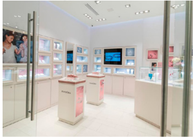
• PANDORA PARQUE ARAUCO AV. PRESIDENTE KENNEDY 5413 | LOCAL 334, PRIMER PISO LAS CONDES | TELÉFONO: +56 2 2380 6073