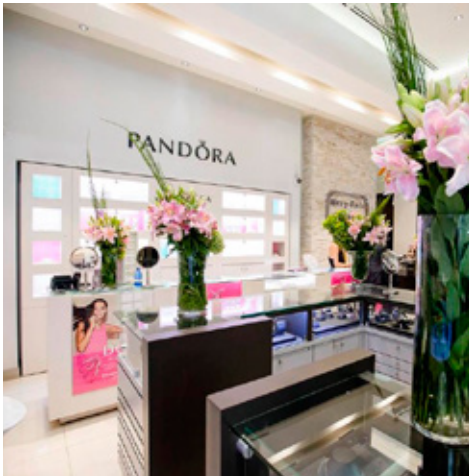
• MERY SATT MALL PORTAL LA DEHESA AV. LA DEHESA 1445 LOCAL 2049 SEGUNDO NIVEL LO BARNECHEA | TELÉFONO: (56 2) 2954 8968