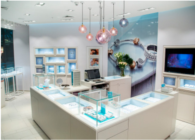
• PANDORA COSTANERA CENTER AV. ANDRÉS BELLO 2465 | LOCAL 3167, TERCER NIVEL PROVIDENCIA | TELÉFONO: +56 2 2618 9883.